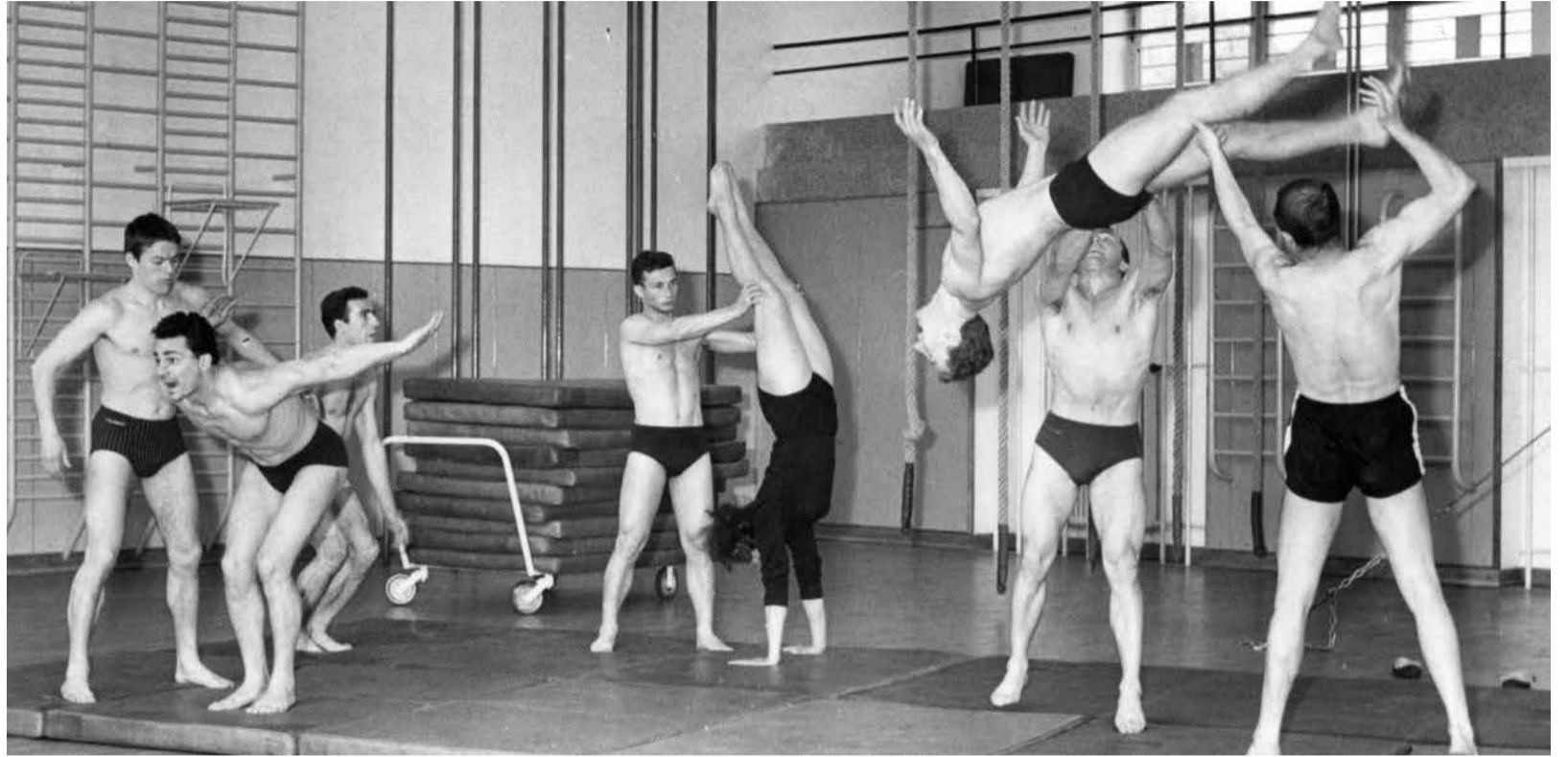
Telovadnica Kodeljevo, maj 1964